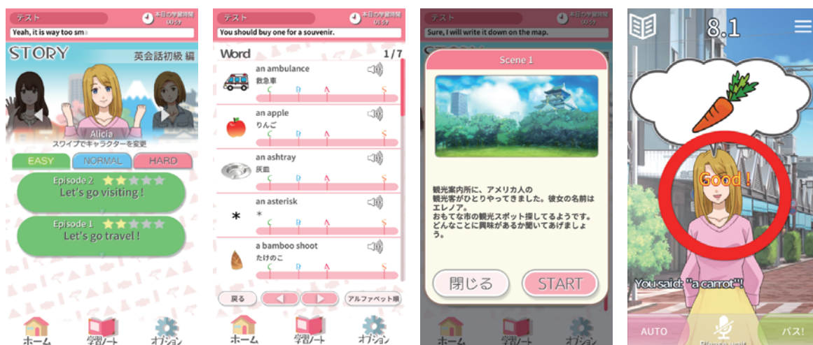
※画面は現在開発中のものとなります

英語力を伸ばすには学校に通って授業を受けるだけでなく、自身で学習をする時間の確保が必要です。つまり、自分で反復練習する時間や外国人との会話量を確保するために、学校の授業に加え「システムを使っていろいろなシチュエーションを体感し実際の会話をたくさん練習してもらいましょう」というのがアプリ制作の背景です。