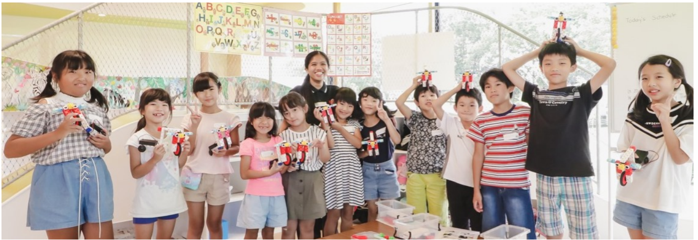
(上)2019年夏休みにトライアル開校した「ESR学童スクール withECC」の様子。保護者満足度100%という高い評価をいただきました。

総合教育・生涯学習機関の株式会社ECC(本社:大阪市北区、代表取締役社長:山口勝美)が運営するECC幼児教育推進課では、幼稚園・保育園を主な対象に、英検®対策と英語プログラミングを基本サービスに含んだ「ECC請負型 英語学童スクール」の販売を開始。小1の壁を解消しながら、教育改革で関心の高まる英語とプログラミングという2大コンテンツを提供する「園内学童」で、保護者と施設のニーズに応えてまいります。