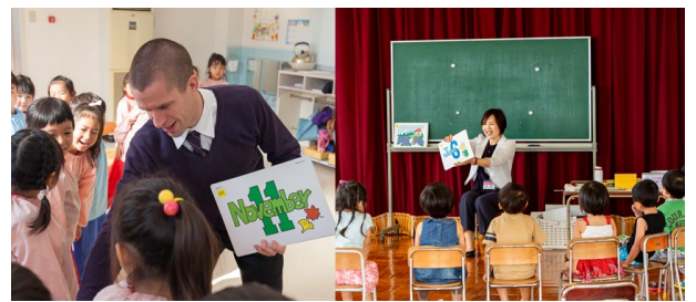
(上) 正課英語カリキュラムのレッスン風景