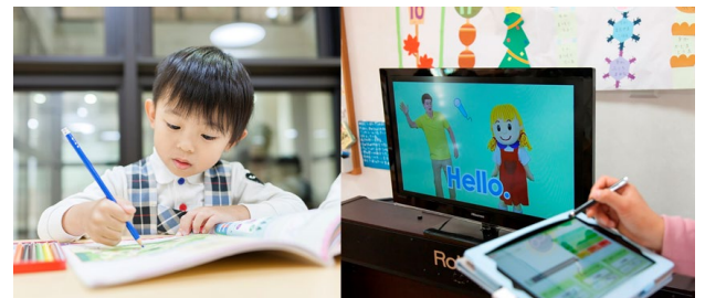
(上・左) 課外英語教室 (上・右) パパッとえいご