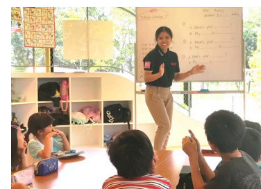
(上)イングリッシュタイム