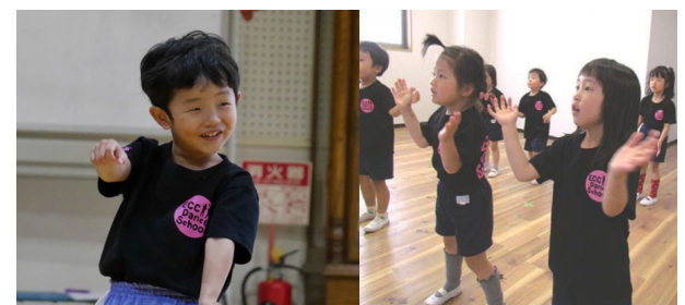
(上) 東名阪で展開中のダンススクール