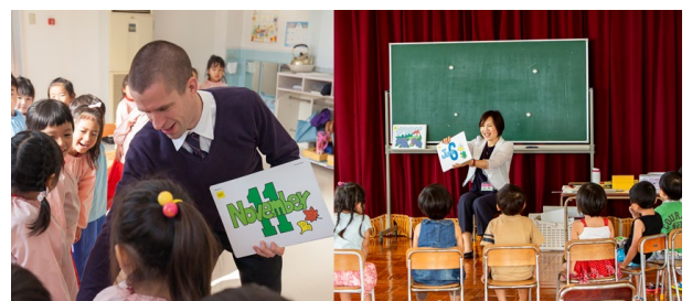
(上) 正課英語カリキュラムのレッスン風景