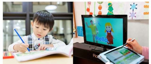
(上・左) 課外英語教室 (上・右) パパッとえいご