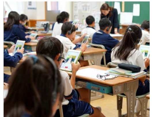
(左・右)近畿大学附属小学校(奈良市)との実証実験の様子 (中)アプリ画面(イメージ)