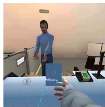
▲ 7月4日(月)に実施されたレッスンの様子

※動画はこちらをご覧ください https://youtu.be/2xWUnqvVTq0